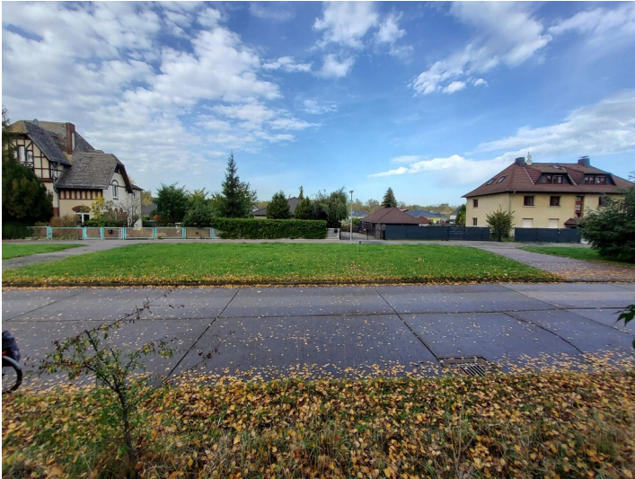
Tagebau Nr. 222 - Von der jüngeren Bebauung auf dem verfüllten alten Tagebaugelände erkennt man hinter den Grundstücksmanern nur die Dachflächen, da sie deutlich tiefer stehen