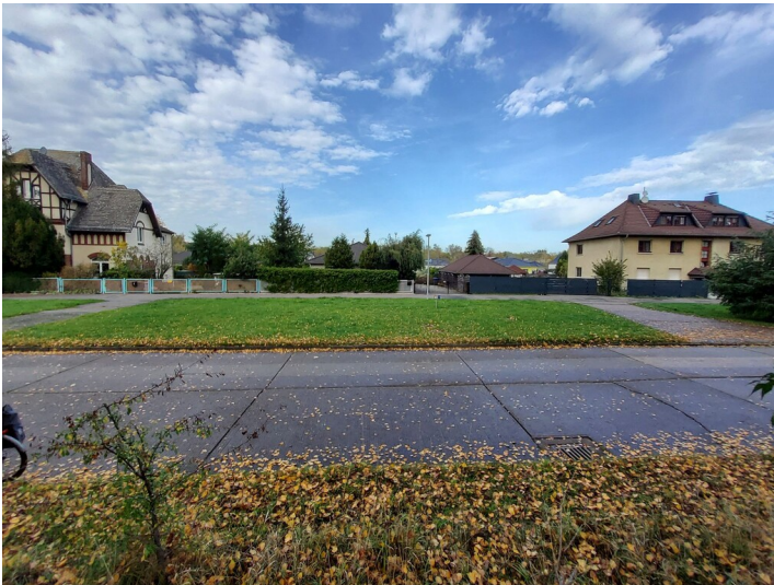
Tagebau Nr. 222 - Von der jüngeren Bebauung auf dem verfüllten alten Tagebaugelände erkennt man hinter den Grundstücksmanern nur die Dachflächen, da sie deutlich tiefer stehen

Schlagwörter: Tagebau Fachsicht(en): Denkmalpflege Gemeinde(n): Bitterfeld-Wolfen Kreis(e): Anhalt-Bitterfeld Bundesland: Sachsen-Anhalt