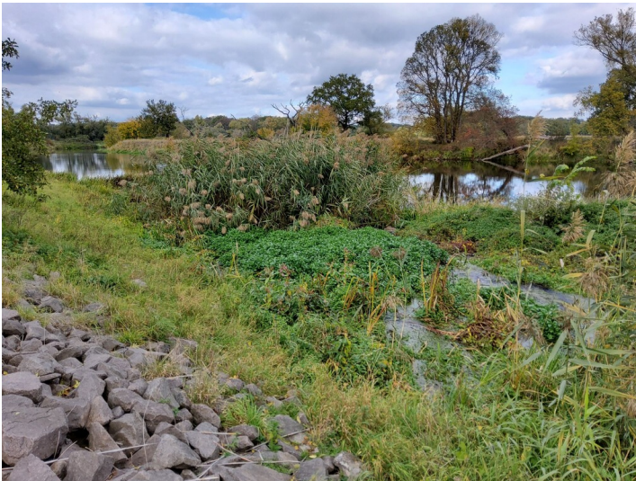
Leine-Lober-Kanal - Mündung des Loberkanals in die Mulde