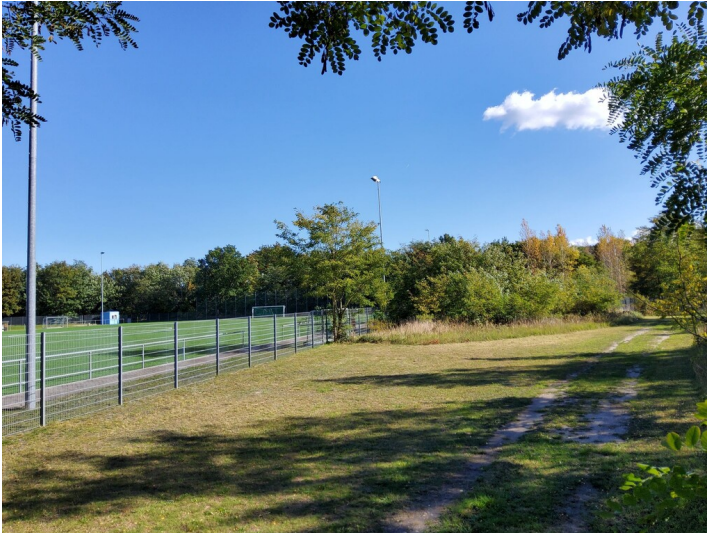
Gut Altschloss - Am Altstandort ""Gut Altschloss"" ist heute der ""Sportpark Süd"" angelegt