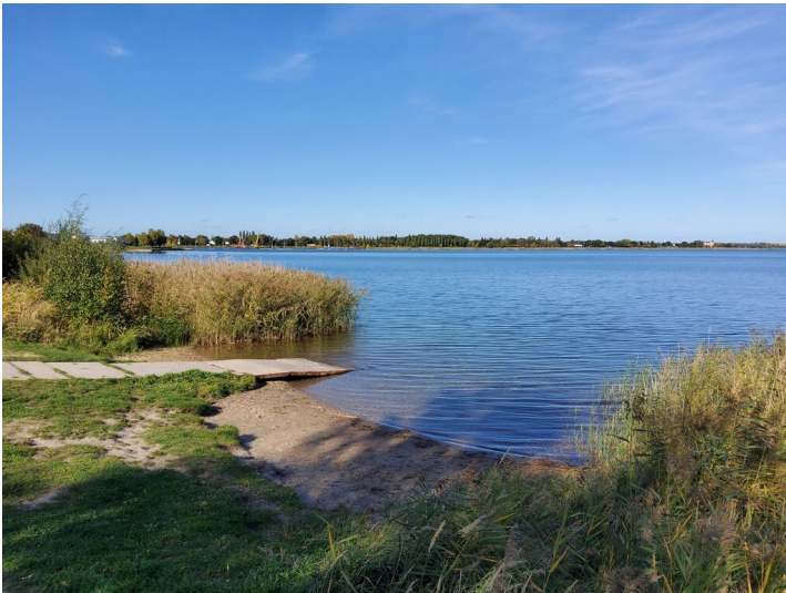
Abbaufeld Niemgk des Tagebaus Goitsche - Das Abbaufeld Niemgk ist mit dem großen Goitzschensee geflutet