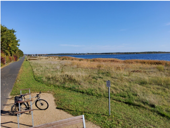
Abbaufeld III b des Tagebaus Goitsche - Blick vom Rastplatz "Seeblick Niemegk" auf das Baufeld III b, das nun mit dem Großen Goitzschensee geflutet ist.