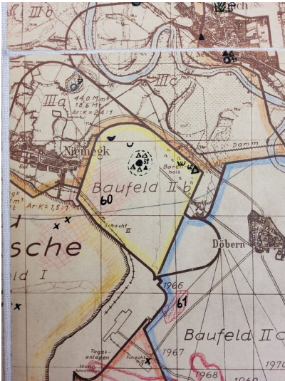
Abbaufeld II b des Tagebaus Goitsche - Tagebau Goitsche Baufeld II b auf dem Übersichtsplan der BKW Einheit von 1963 (Kreismuseum Bitterfeld VIII C 13780)