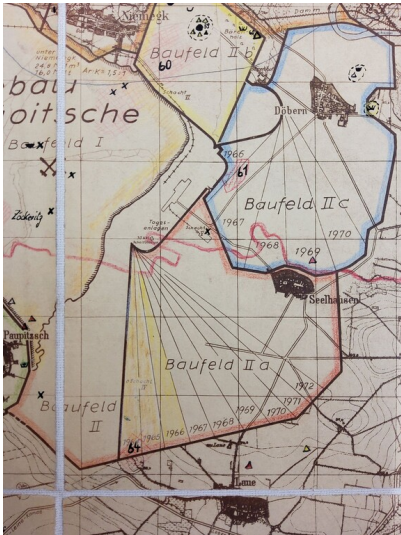
Abbaufeld II a des Tagebaus Goitsche - Tagebau Goitsche Baufeld II a auf dem Übersichtsplan der BKW Einheit von 1963 (Kreismuseum Bitterfeld VIII C 13780) Fotograf/Urheber: NAME FEHLT