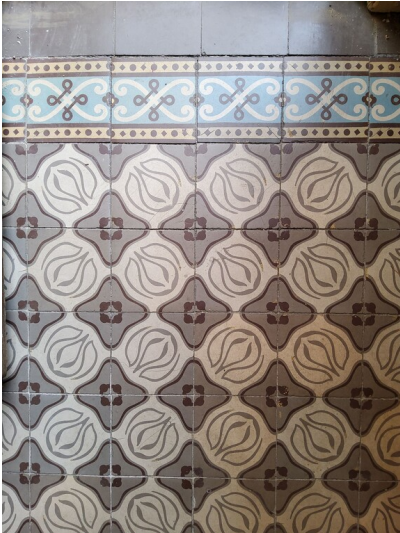
Katholisches Gemeindehaus St. Franziskus Bitterfeld - Fußbodenbelag im Erdgeschoss aus Fliesen der Polko-Werke, Bitterfeld