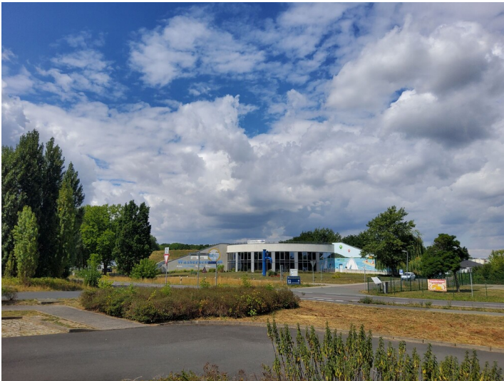
Wasserzentrum Bitterfeld - Eingangssituation