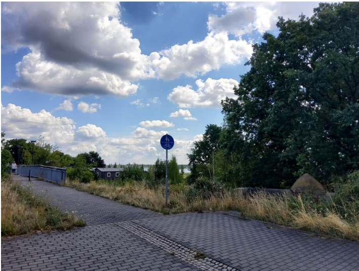
Alte Muldebrücke - Blick zum See