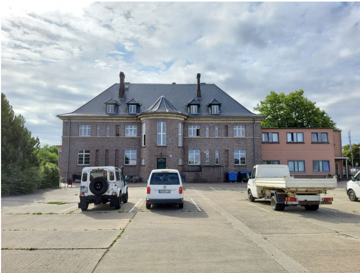
Verwaltungsgebäude des Steinzeugwerks - straßenabgewandte Nordwestfassade