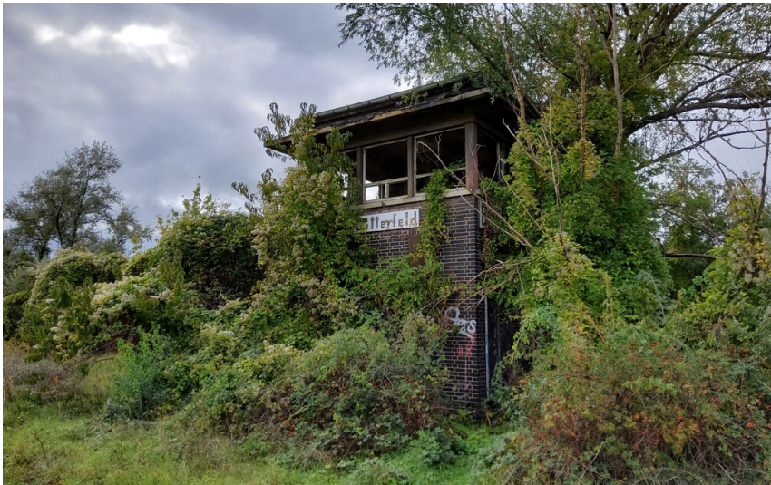
Stellwerk der Strecke Bitterfeld-Stumsdorf - streckenseitige Ansicht