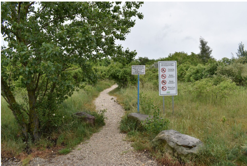
Großtagebau Profen - Große Teile des Großtagebaus Profen sind schon wieder rekultiviert und renaturiert