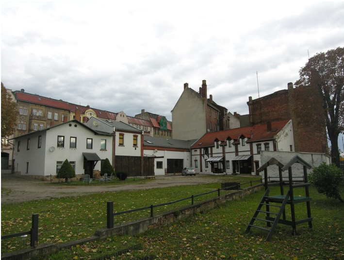
Verkaufslager für Kohlen