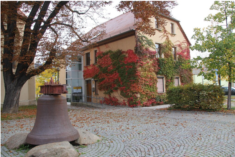
Haus der Stadtgeschichte - Gesamtansicht