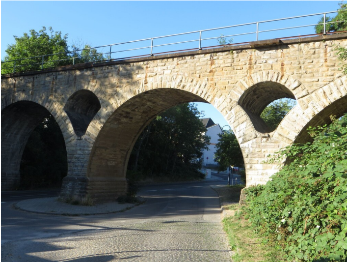
Eisenbahnbrücke Strecke Naumburg - Zeitz - Straßenseitige Gesamtansicht