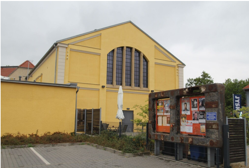
Elektrizitätswerk Naumburg - Turbinenhaus hofseitig