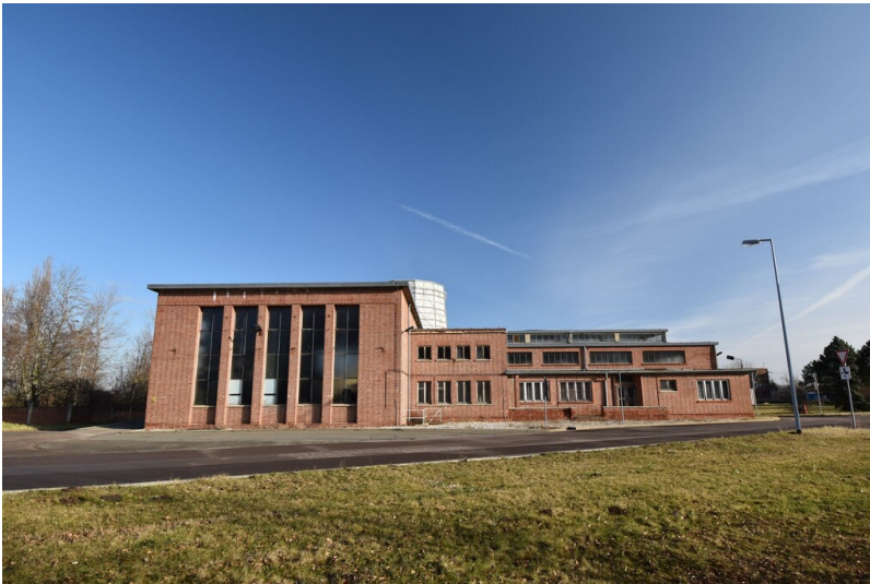
Lagergebäude Deuben - Südfassade des Materiallager