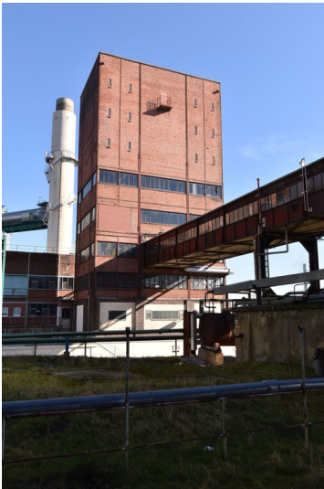
Schwelereiturm Deuben mit Werksuhr - Blick aus Richtung Süden