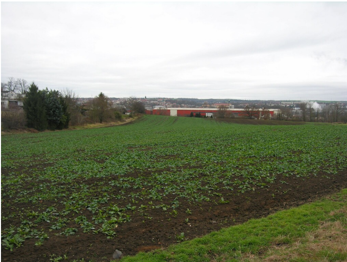
Schacht der Grube Agnes (1869) - etwaige Situation des Schachtes der Grube Agnes; Blick Süd, nach Zeitz