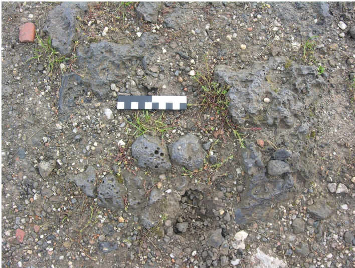
Bruchfeld der Grube Sophie (1871-1882) - Wegebefestigungen mit Schlacken aus verschiedenen Zeitzeir Eisengießereien des 19. Jh., wie z.B. der ZEMAG