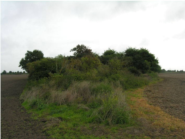
Aschehalde der Schwelerei Grube 486 (nach 1860-1874) - bewachsene Aschehalde; Blick W