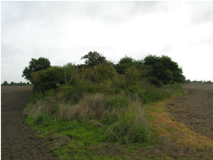
Aschehalde der Schwelerei Grube 486 (nach 1860-1874) - bewachsene Aschehalde; Blick W