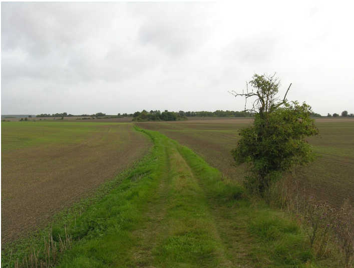
Schacht, Tagesanlage und Fabrik der Grube 486 (nach 1860-1874) - Weg zur Grube 486; Blick W