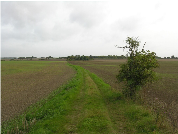
Schacht, Tagesanlage und Fabrik der Grube 486 (nach 1860-1874) - Weg zur Grube 486; Blick W