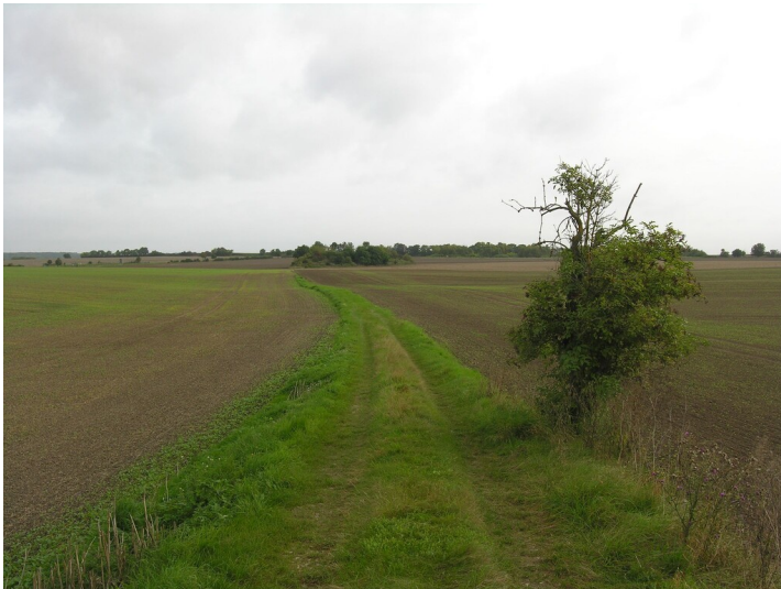
Schacht, Tagesanlage und Fabrik der Grube 486 (nach 1860-1874) - Weg zur Grube 486; Blick W