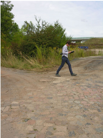
Werkstraße der Brikettfabrik Theißen (nach 1899) - gepflasterter Weg zur der Brikettfabrik; Blick N