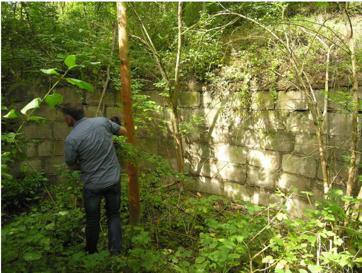
Kraftwerk Theißen (1926-1971) - Fundamentreste der Schornsteine aus Betonsteinen