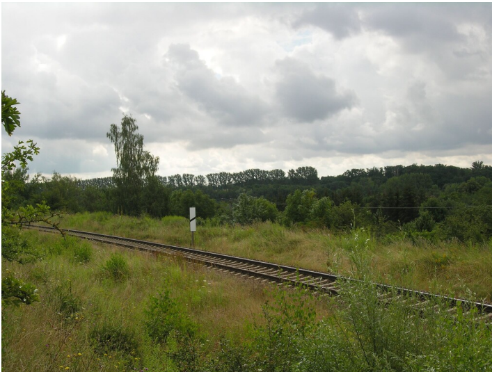
Damm der Eisenbahntrecke Zeitz-Weißenfels (1859) - Bahndamm, Blick SE