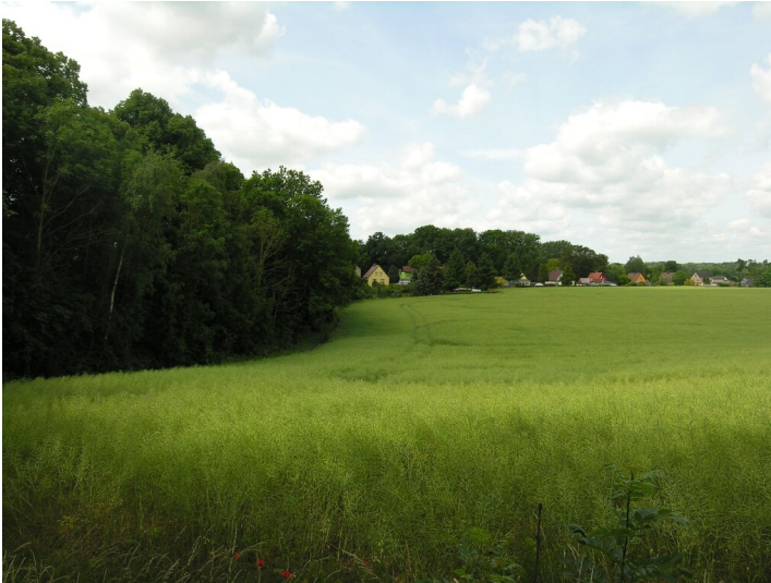
Tief- und Tagebaugrube des Rittergutes T. Schmalz - vermutliche Lage des Tagebaus von Schmalz; Blick in westliche Richtung nach Reußen