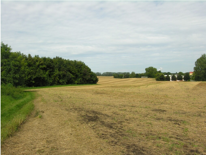
Bruchfeld der Grube Otto (1880-1911) - Situation des Bruchfeldes heute, Blick N