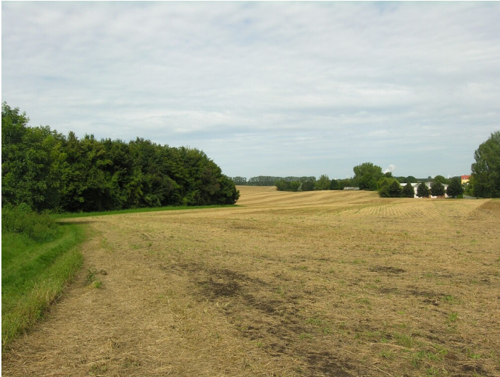
Bruchfeld der Grube Otto (1880-1911) - Situation des Bruchfeldes heute, Blick N