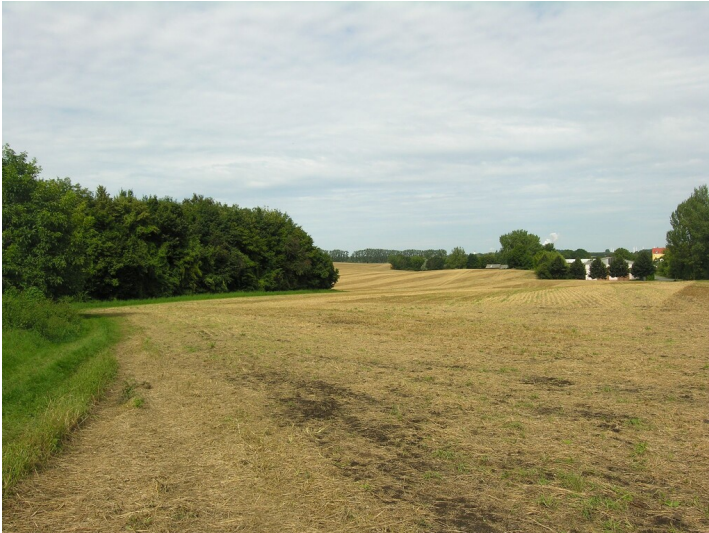
Bruchfeld der Grube Otto (1880-1911) - Situation des Bruchfeldes heute, Blick N