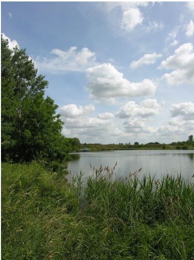
Tagebau der Grube Virginia (1889-1959) - See im Tagebaurestloch Virginia; Blick W