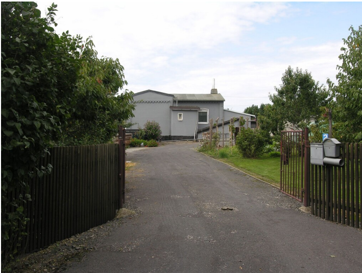
Schacht II der Grube 522 Wilhelm (1893-um 1910) - Werksgelände von Schacht II; Blick W