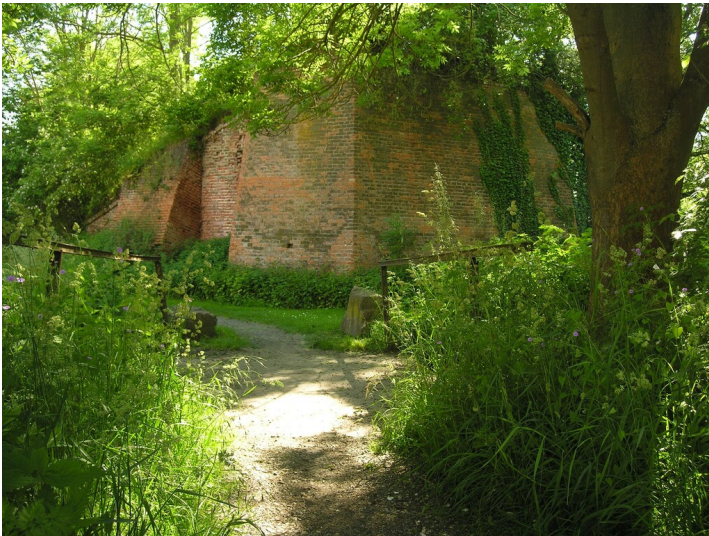
Damm eines Anschlussgleises zu den Fabriken Grube Emma und Grube Kurt (nach 1871-1960) - Stützmauer für die Überbrückung des Maibaches, Blick SW