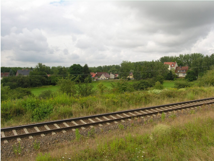
Vermutliches Bruchfeld der Grube Virginia (vor 1895) - Bruchfeld der Grube Virginia, Wiesen jenseits des Bahndammes; Blick Richtung SW nach Luckenau