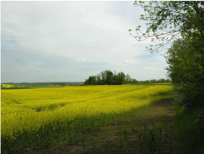
Schacht, Tagesanlagen und Fabrik der Grube 257 (1850-1911) - ehemaliger Fabrikstandort, im Vordergrund rechts; Blick NE