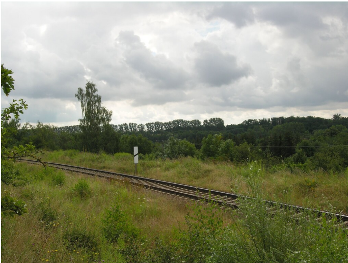
Schacht, Tagesanlagen und Fabrik der Grube Virginia (1889-1920) - Situation der ehemaligen Fabrik Grube Virginia, rechts hinter dem Bahndamm; Blick SE