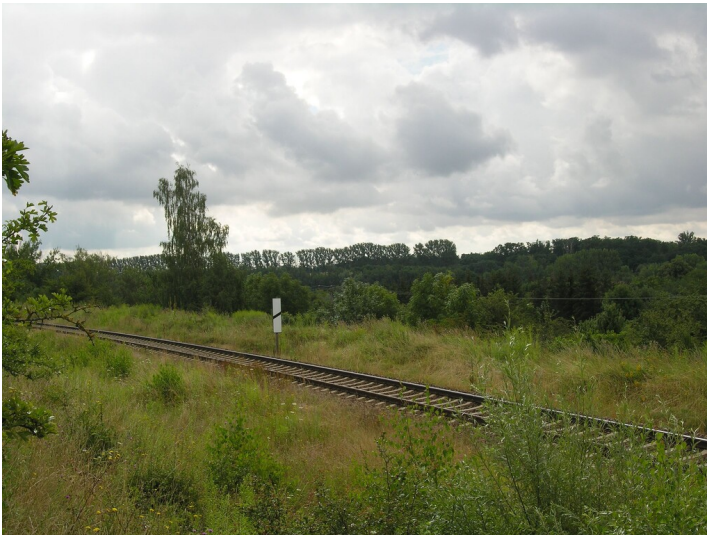
Schacht, Tagesanlagen und Fabrik der Grube Virginia (1889-1920) - Situation der ehemaligen Fabrik Grube Virginia, rechts hinter dem Bahndamm; Blick SE