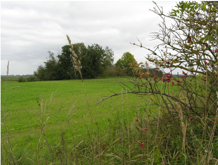
Aschehalde einer Schwelerei (1880-1911) - die Aschehalde als bewaldeter Hügel; Blick NE