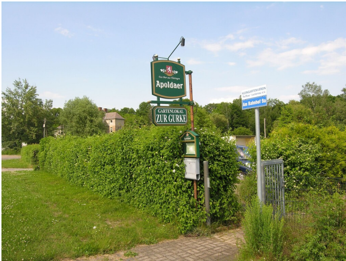
Abbaufeld des Tagebaus Grube Emma (ab 1912-1923) - Kleingartenanlage mit Spartenheim "Zur Gurke".

Schlagwörter: Tagebau Fachsicht(en): Denkmalpflege Gemeinde(n): Teuchern, Zeitz Kreis(e): Burgenlandkreis Bundesland: Sachsen-Anhalt