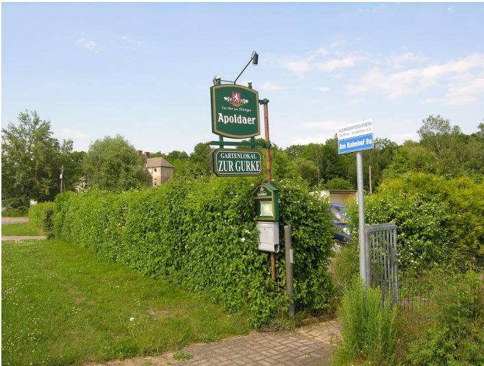
Abbaufeld des Tagebaus Grube Emma (ab 1912-1923) - Kleingartenanlage mit Spartenheim "Zur Gurke".