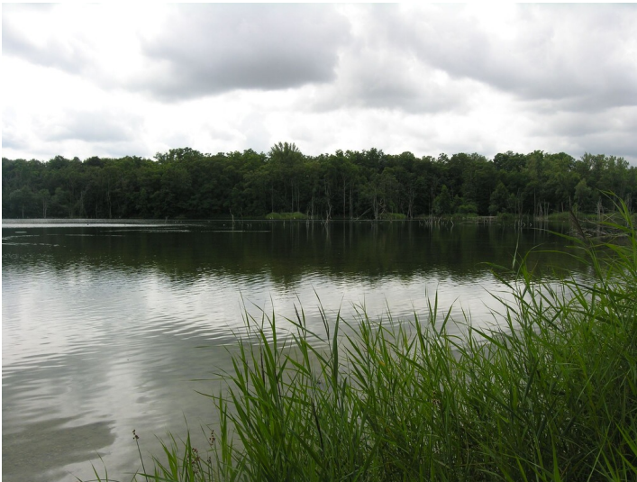
Tagebau der Grube Neue Sorge III (1912/17-1932) - See im Tagebau Neue Sorge III; Blick W