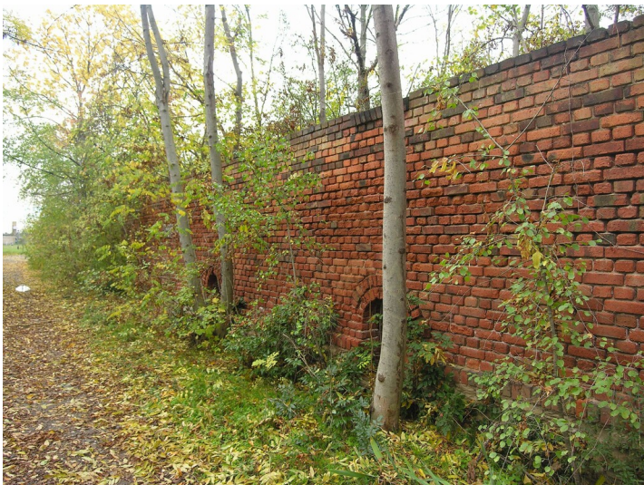
Chemische Fabrik und Glashütte Korbetha - Produktionsgebäude zur Säureherstellung, Südseite