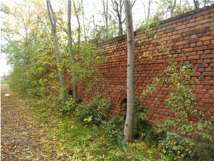
Chemische Fabrik und Glashütte Korbetha - Produktionsgebäude zur Säureherstellung, Südseite