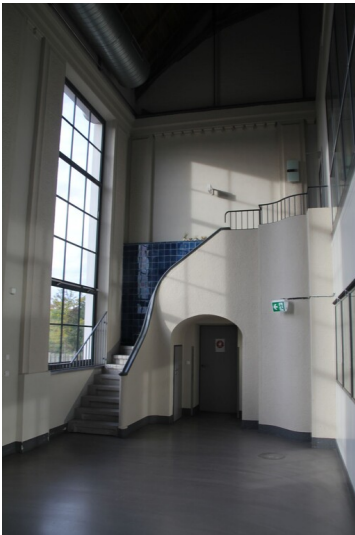
Heizwerk Nord, Elektrizitätswerk Weißenfels - Treppenaufgang