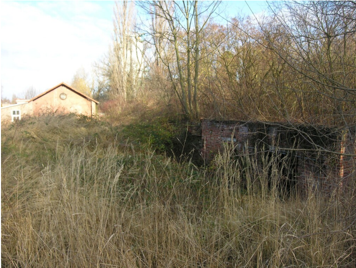
Elektrischen Zentrale der Grube Naumburg - Ruine der ehemaligen Elektrischen Zentrale