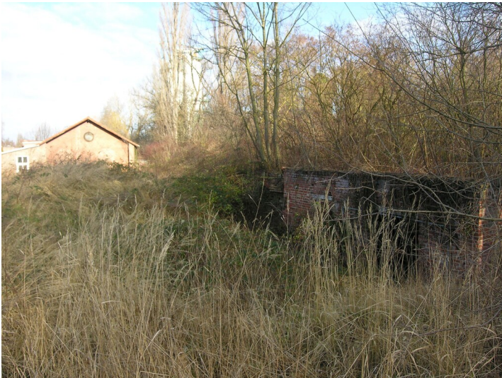
Elektrischen Zentrale der Grube Naumburg - Ruine der ehemaligen Elektrischen Zentrale