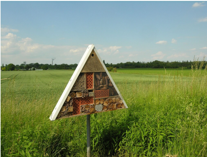
Tagebau der Grube Jacob (1898-1947) - verfüllter Tagebau der Grube Jacob; Blick Nord