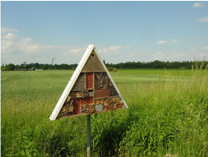
Tagebau der Grube Jacob (1898-1947) - verfüllter Tagebau der Grube Jacob; Blick Nord