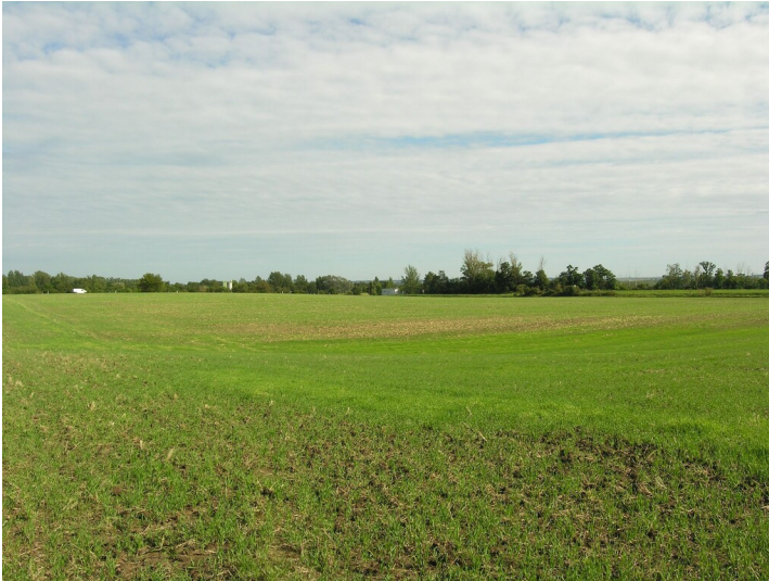
Bruchfeld der Grube Trebnitz - das Bruchfeld; Blick E, Richtung Trebnitz