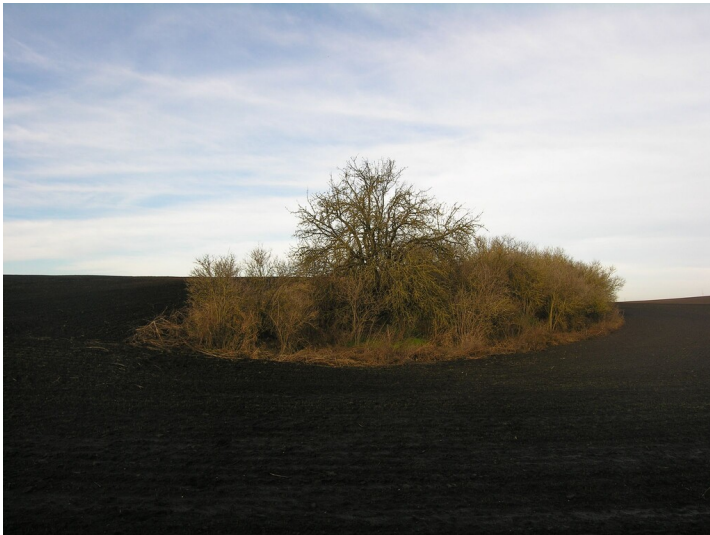
Aschehalde der Grube 439 (bis ca. 1890) - die Aschehalde von Osten gesehen