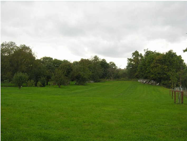
Schacht, Tagesanlagen und Fabrik der Grube Hermann Ernst (1880-1891) - Situation der ehemaligen Tagesanlage und Fabrik; Blick W