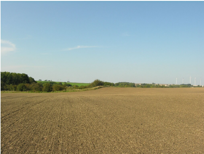
Schacht, Tagesanlage und Nasspresse der Grube 460 (um 1869) - etwaige Situation hier vermuteter Tagesanlagen der Grube 460; Blick N