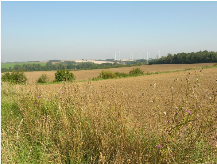
Kippe mit Abraum aus Aufschlussarbeiten für Tagebau der Grube von Voß - überkipptes Gelände; Blick N

Schlagwörter: Abraumhalde Fachsicht(en): Denkmalpflege Gemeinde(n): Teuchern Kreis(e): Burgenlandkreis Bundesland: Sachsen-Anhalt