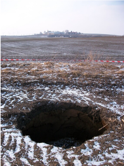
Bruchfeld der Grube 334 - Tagesbruch im Winter 2011; am Horizont die ehemalige Paraffin- und Mineralölfabrik Teuchern; Blick NW