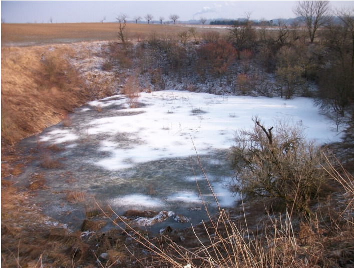
Tagebau der Grube 350 Carl August - das südliche Tagebaurestloch