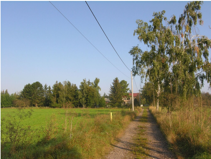
Grube 271 - Anfahrt zum ehemaligen Werksgelände der Grube 271; Blick N