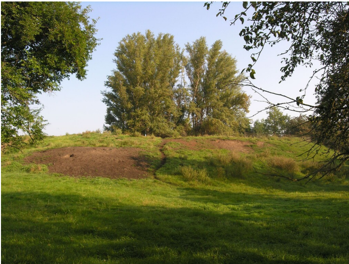
Aschehalde der Schwelerei Grube 524 - Aschehalde, von Süden gesehen

Schlagwörter: Abraumhalde Fachsicht(en): Denkmalpflege Gemeinde(n): Teuchern Kreis(e): Burgenlandkreis Bundesland: Sachsen-Anhalt